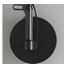
DEMETRA SUPPORTO W GRO1742010A