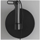
DEMETRA SUPPORTO W GRO1742010A